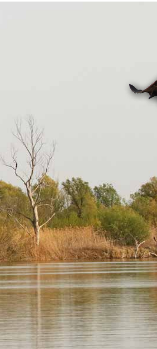
Die zahlreichen Wasserläufe des Schutzgebiets sind von ausgedehnten Schilf- und Auwäldern gesäumt.

ges Naturschutzgebiet). Im kleinen Weiler Damchik leben ausschließlich Angestellte des Schutzgebiets und hier starten zweimal täglich unsere ausgedehnten Ausflüge mit den reservatseigenen Motorbooten. Diese bilden in dieser weglosen Wasserwildnis am Rande des Kaspischen Meeres die einzige Transportmöglichkeit.